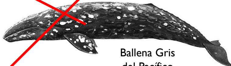
Ballena Gris del Pacífico