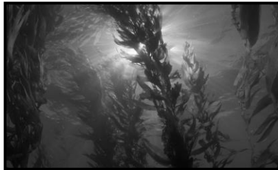
BOSQUE DE ALGAS