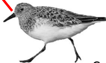
Correlimos de Alaska