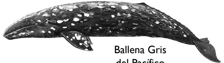
Ballena Gris del Pacífico