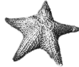
Estrella de Mar